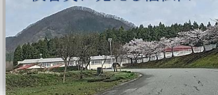
校舎奥に見える福伝山